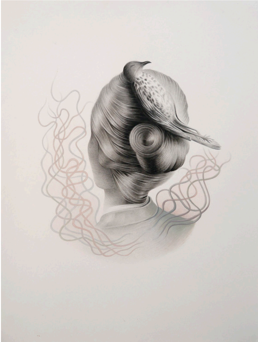
Sans titre (Abbadia 6), 2013, crayon graphite et gouache sur papier, 32 x 42 cm

For all images request, please contact Audrey Pedron : images@airdeparis.com